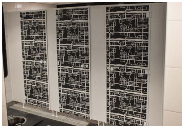
LamiGraphiqs, Skellefteå Airport.