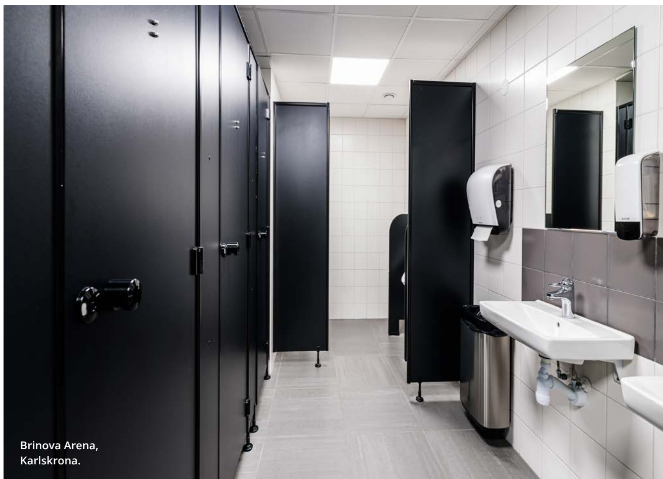
Brinova Arena, Karlskrona.